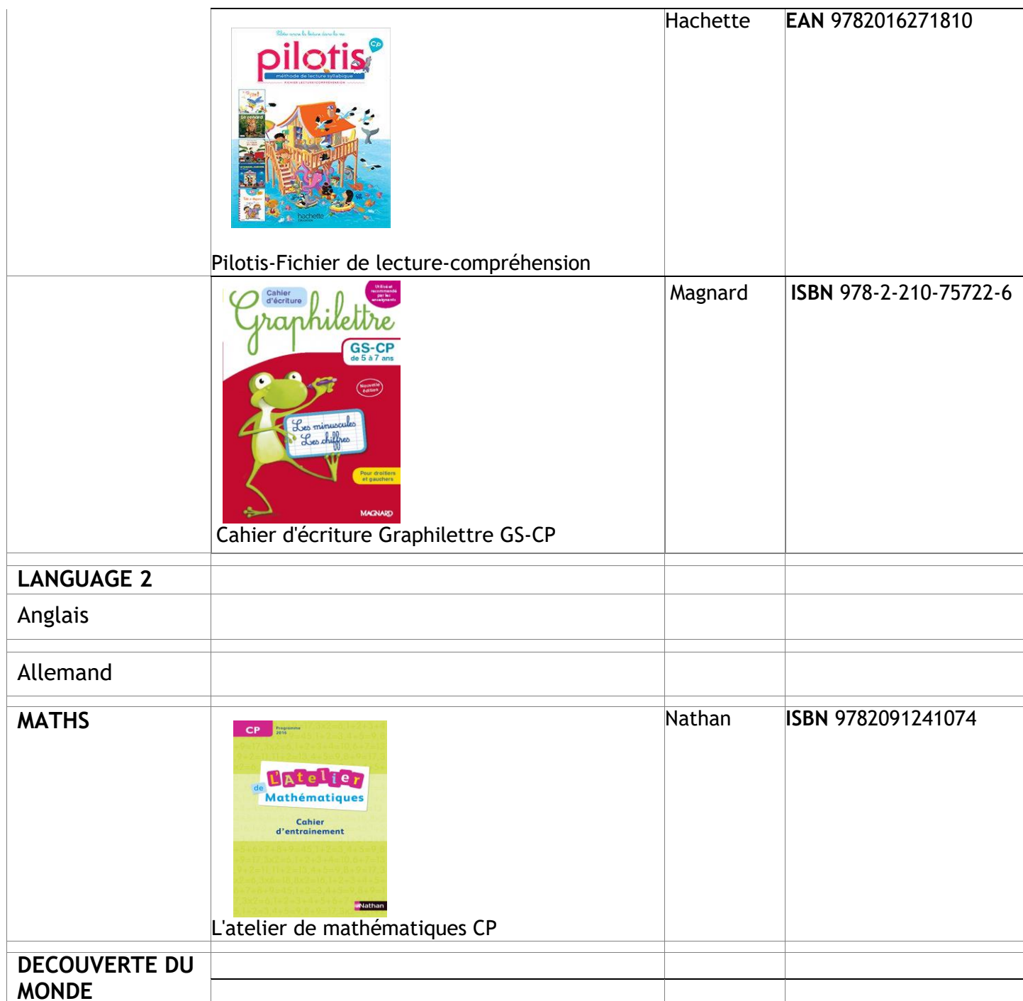
Pilotis-Fichier de lecture-compréhension